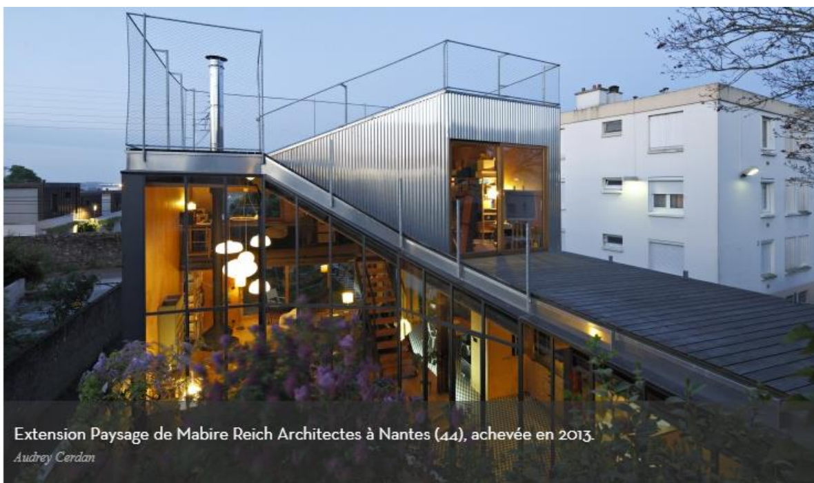
Extension Paysage de Mabire Reich Architectes à Nantes (44), achevée en 2013.