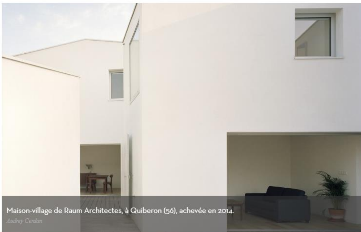
Maison-village de Raum Architectes, à Quiberon (56), achevée en 2014.

Lauréat de la mention spéciale du jury, l'architecte Hervé Gaillaguet est récompensé pour sa Maison Lucarne qui réinterprète avec audace les réglementations du plan local d'urbanisme pour aboutir à un logement vertical à la géométrie singulière. « Un vrai travail contemporain sur une typologie compliquée » selon le jury, séduit par « la façade sud ludique et toute en ardoise ».