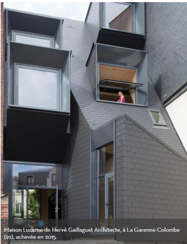
Maison Lucarne de Hervé Gaillaguet Architecte, à La Garenne-Colombe (92), achevée en 2015.

Grand prix du jury, la Maison à claire-voie de l'agence Devaux & Devaux a su gagner les faveurs du jury avec « une véritable maison-fenêtre qui permet de réguler le rapport des habitants à l'extérieur » grâce à « un très bel usage du matériau bois pour un projet cohérent, maîtrisé et joliment dessiné » .