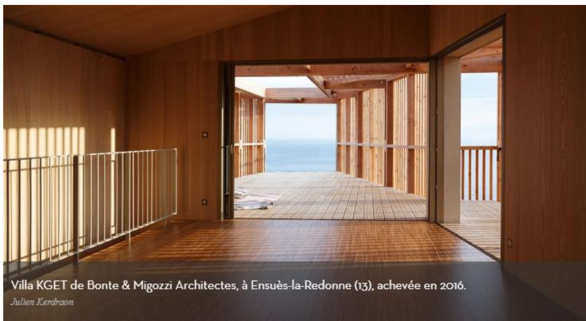
Villa KGET de Bonte & Migozzi Architectes, à Ensues-la-Redonne (13), achevée en 2016.

Le trophée des petits projets et extensions est décerné à l'agence Mabire Reich pour « l'usage du toit et la création de séquences visuelles fortes, presque photographiques » de son projet métallique relié à une maison ouvrière des années 1930. Accessibles par des rampes, ses terrasses successives donnent naissance à « un véritable parcours architectural ».