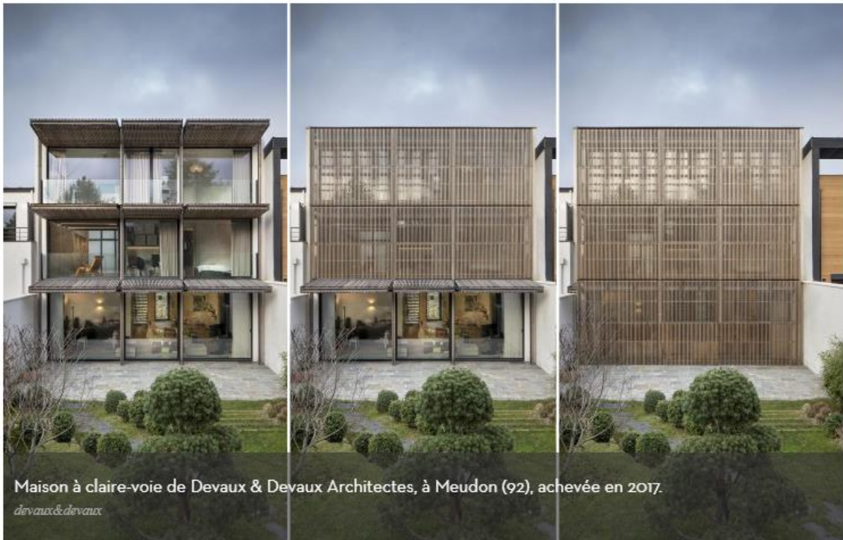
Maison à claire-voie de Devaux & Devaux Architectes, à Meudon (92), achevée en 2017.